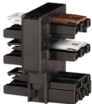
WINSTA® MIDI H-verdeler