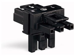
WINSTA® MIDI T-verdeler