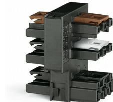
WINSTA® MIDI T-verdeler

* WAGO heeft meerdere varianten verdeelblokken beschikbaar