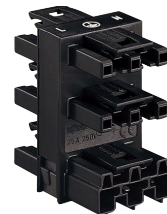
WINSTA® MIDI 5 voudige verdeler