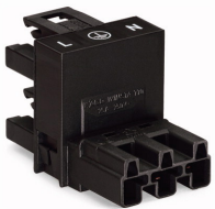
WINSTA® MIDI H-verdeler